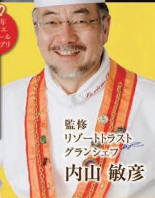
監修 リゾートトラスト グランシェフ 内山 敏彦