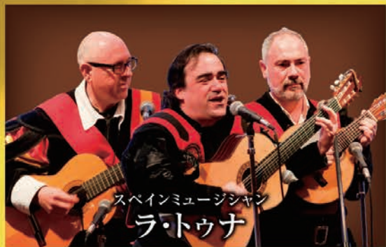
スペインミュージシャン ラ・トゥナ