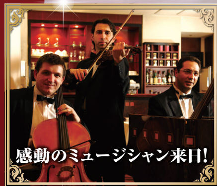
感動のミュージシャン来日!

■開催日/2018年10月1日(月) ■時間/18:00～(受付)/18:30～(開演)